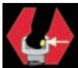
ネジつかみ機能付

ボンダス独自の黒染め加工により、通常の黒染め加工の5倍の耐蝕性と高い耐溶剤性を実現しています。